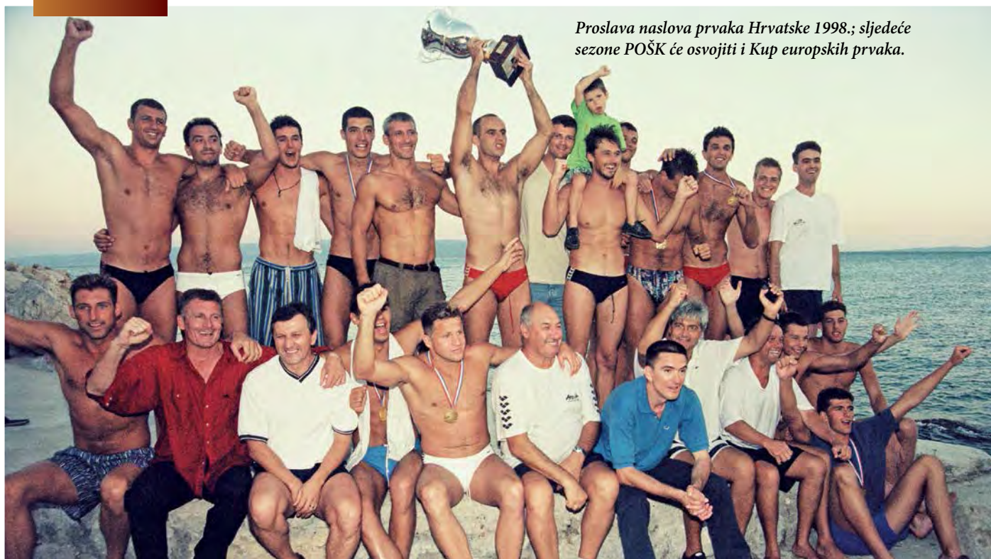
Proslava naslova prvaka Hrvatske 1998.; sljedeće sezone POŠK će osvojiti i Kup europskih prvaka.

kolektivu uspješan početak rada i čestitaju mu na prvom uspjehu.”