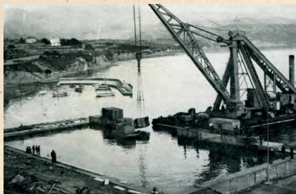
Dizalica "Marjanka" pomaže u izgradnji plivališta na Zenti

Nakon što POŠK nije uspio u nakani osvajanja prvenstva ondašnje države, najdarovitija generacija ubrzo se razila, velik